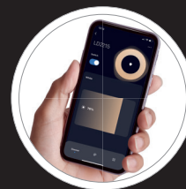
Per APP steuerbar Helligkeit und Farbtemperatur ganz nach Wunsch