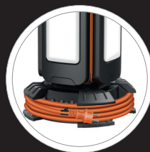
Platzsparend und sauber - Fuß mit Kabelaufnahme