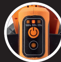
Manuell dimmbar: 3-stufig